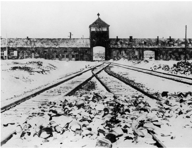
3. Железнодорожные пути, ведущие в концлагерь Освенцим, февраль 1945 г.