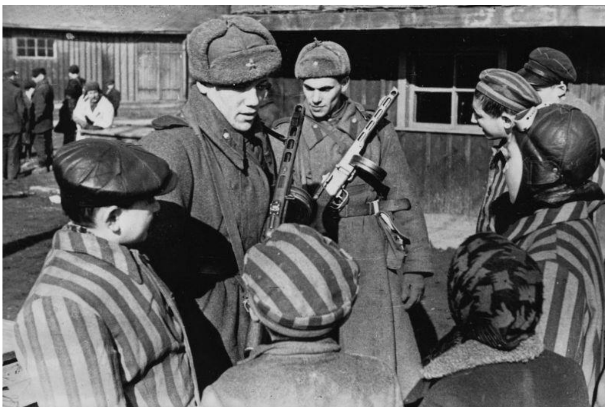
Советские солдаты общаются с детьми, освобожденными из Освенцима, январь 1945 г.