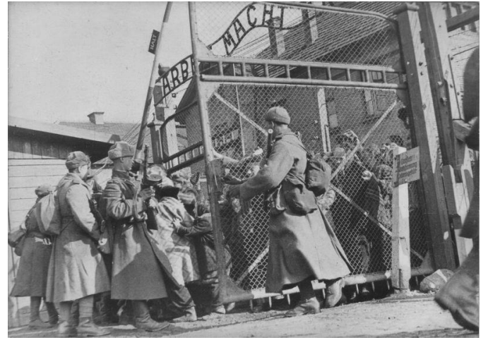
2. Советские солдаты открывают ворота концлагеря Освенцим, освобождая заключенных, 27 января 1945 г.