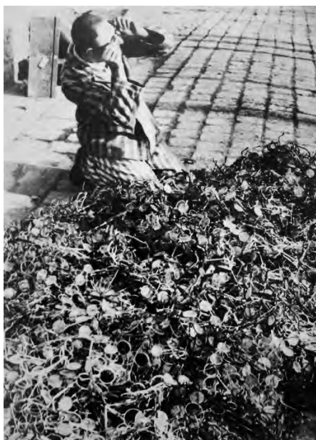
Бывший узник концлагеря Освенцим подбирает себе очки, 1945 г.

Ниже представлены исторические источники, которые могут быть использованы вами для подготовки памятных мероприятий, посвящённых 80-летию со дня освобождения концентрационного лагеря Освенцим, а также вопросы и задания к ним. Исторические источники представлены в соответствии с познавательным и психологическим уровнем обучающихся и организованы по уровням образования.