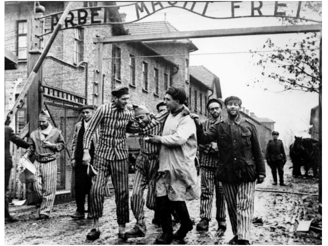
8. Освобожденных узников концлагеря Освенцим выводят из лагеря, февраль 1945 г.