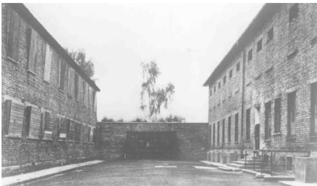
11. «Черная стена» между блоком 10 (слева) и блоком 11 (справа) в концентрационном лагере Освенцим, где производились казни заключенных, дата неизвестна