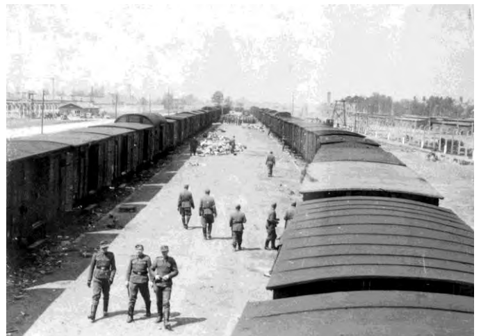
12. Платформа концентрационного лагеря Освенцим. Сбор вещей, отобранных у узников, отправленных в лагерь, дата неизвестна