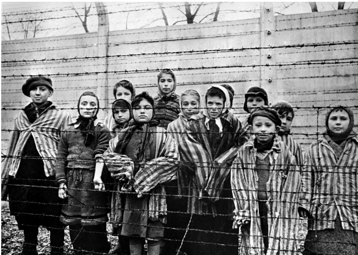
Освобожденные дети Освенцима, январь 1945 г.

Эти вещи нацисты планировали использовать в своих целях после убийства их обладателей, можно ли сказать, что убитых людей ограбили?