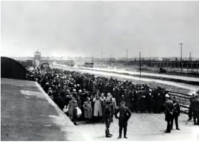
1. Привезенные евреи из Венгрии выстраиваются для селекции в концлагере Освенцим, май 1944 г. (На заднем фоне видны ворота лагеря)