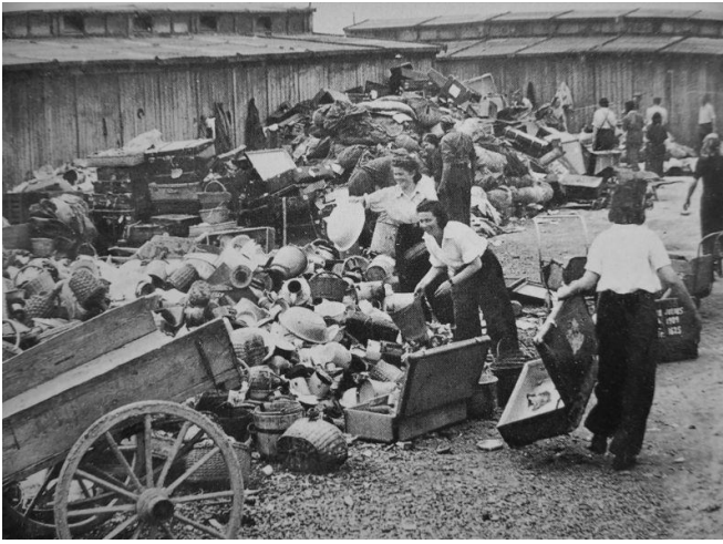
7. Сортировка вещей евреев, доставленных в концлагерь Освенцим, май 1944 г.