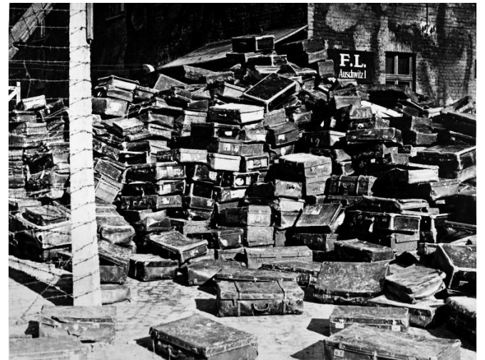
4. Чемоданы бывших узников нацистского концентрационного лагеря Освенцим с маркировками всех стран Европы, 27 января 1945 г.