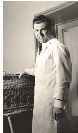
6. Врач-садист Йозеф Менгеле, проводивший медицинские опыты на узниках концлагеря Освенцим, более известный под прозвищем «Ангел смерти», дата неизвестна