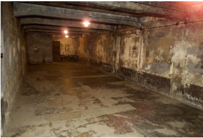
13. Газовая камера в концентрационном лагере Освенцим. Наши дни