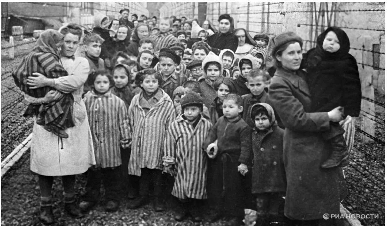
Группа детей, освобожденных из концлагеря Освенцим, февраль 1945 г.

Вопросы. Дети были самыми беззащитными узниками концентрационного лагеря «Освенцим». Они находились в ещё большей опасности, чем взрослые. Многие из них были вашими ровесниками, и даже младше.