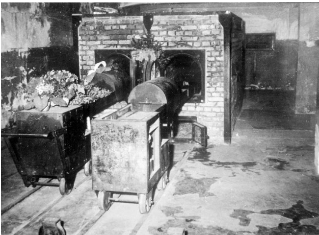
5. Крематорий в концентрационном лагере Освенцим, 1945 г.