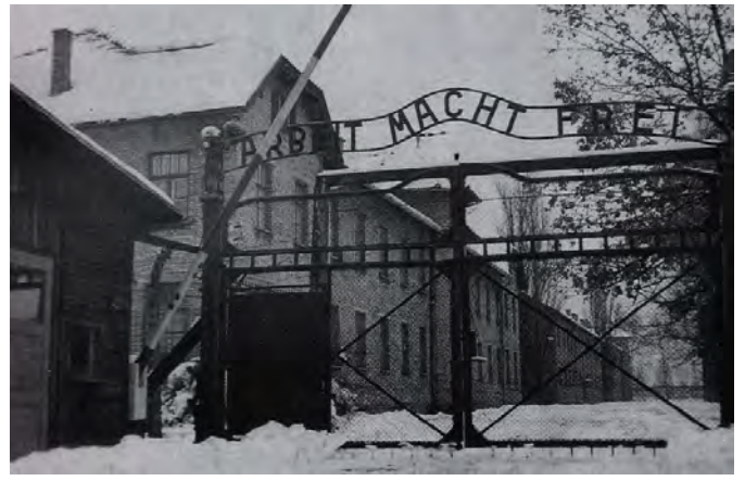
14. Главные ворота концлагеря Освенцим, дата неизвестна