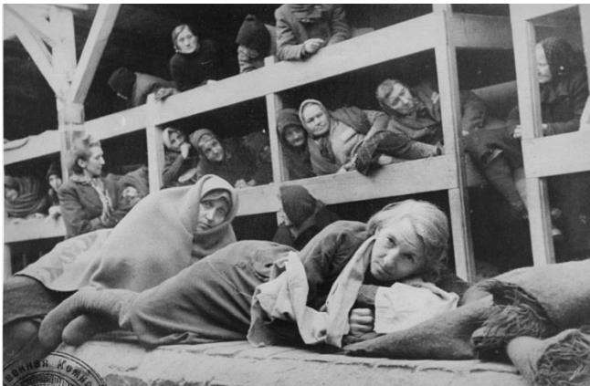
9. Вскоре после освобождения Освенцима советскими войсками: женщины, пережившие заключение в лагере, прижимаются друг к другу в бараках. Освенцим, 1945 г.